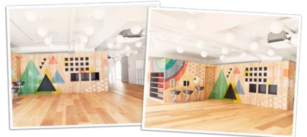
▲6月末に譲受予定の「めばえ保育ルーム」